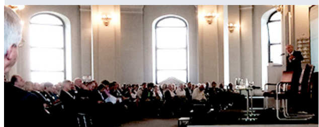
Mehr als 400 Vertreter aus Politik, Wirtschaft, Wissenschaft sowie kirchlichen und zivilgesellschaftlichen Verbänden nahmen am Kongress der Ökumenischen Sozialinitiative in Berlin teil.